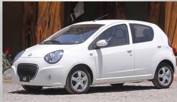
Esto lo convierte en el primer auto chino en obtener esta calificación en un test de seguridad.