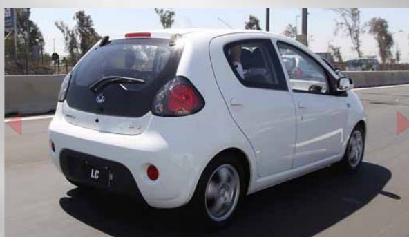
Además está equipado con tanque de combustible anti-derrame y anti-explósión, entre otros