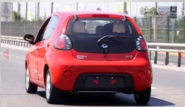
C-NCAP, versión china de EuroNCAP, recientemente le otorgó cinco estrellas en prueba de choque frontal y lateral.