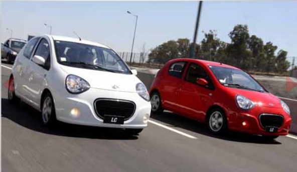
Cuenta con un completo equipamiento, destacando aire acondicionado y dirección electro asistida.