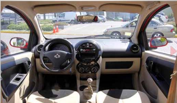
Cuenta con cinturones delanteros y traseros de tres puntas, alarma para el uso de cinturones y de aviso por puerta abierta.