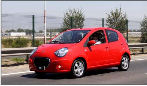
Geely trae su nuevo city car Image 11 of 11