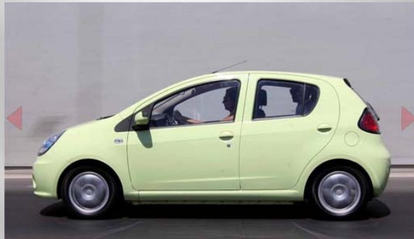
Incluye llantas de aluminio, neblineros, apertura de maletero a distancia y Radio CD con MP3.